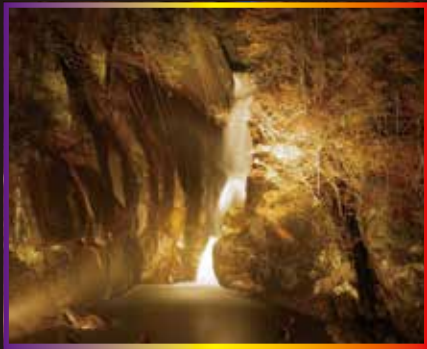
仙娥滝ライトアップ