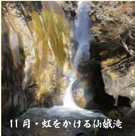
11月・虹をかける仙娥滝